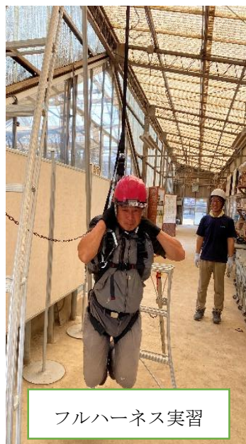
フルハーネス実習