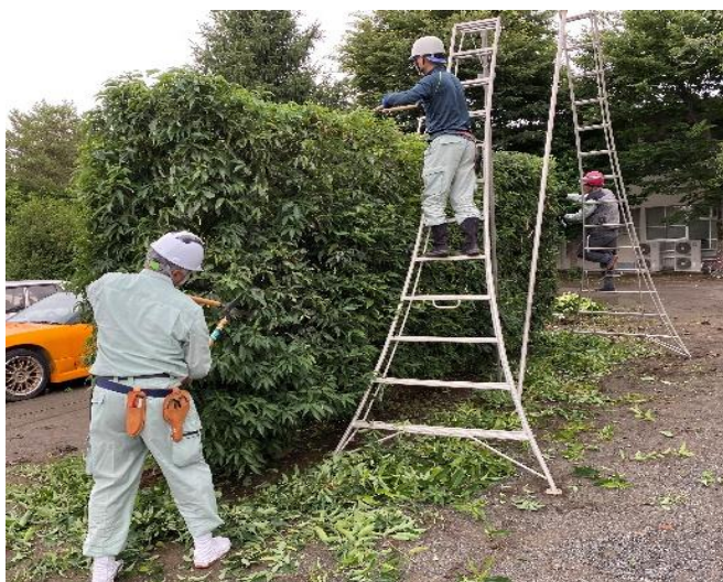
ふかや緑の王国園内の樹木を中心に管理作業