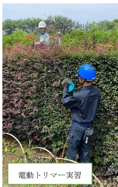
電動トリマー実習